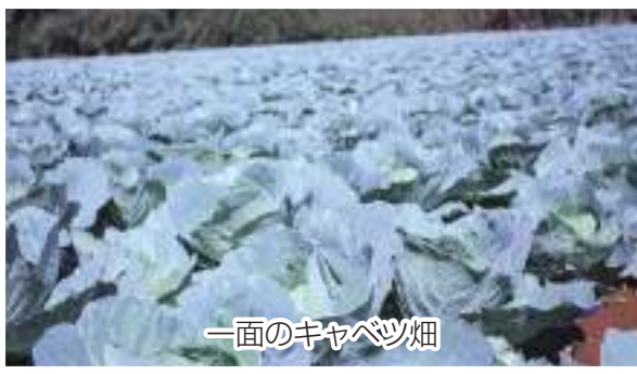
一面のキャベツ畑