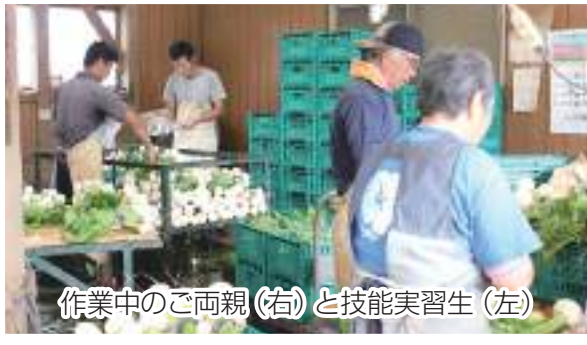
作業中のご両親(右)と技能実習生(左)